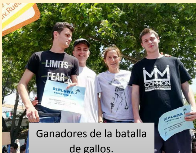
Ganadores de la batalla de gallos.

Se sucedieron otras animaciones y actividades lúdicas como zumba y la conocida como “batalla de gallos” que consiste en duelos improvisados de música rap, organizada por los alumnos.