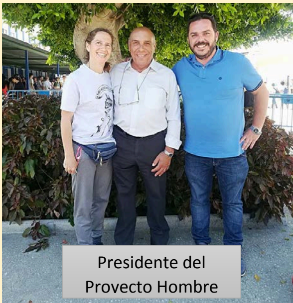
Presidente del Proyecto Hombre

Con el fin de recaudar la mayor cantidad de fondos posibles para ayudar a La Asociación Fortaleza de la Axarquía (AFAX Proyecto Hombre), cuyo principal objetivo es trabajar con un sistema terapéutico de rehabilitación de drogodependientes, mejorando la calidad de vida de estas personas.